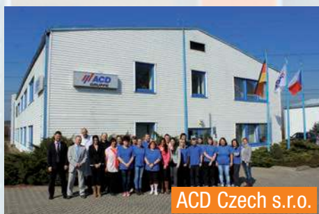
ACD Czech s.r.o.

ACD Systemtechnik GmbH Elektronische Produktionsdienstleistungen (EMS)