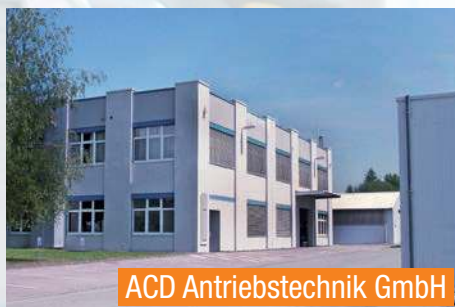
ACD Antriebstechnik GmbH

ACD Elektronik GmbH Entwicklung mobiler Geräte und Anwendungen in der Industrie-elektronik und deren Produktion