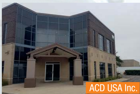
ACD USA Inc.

ACD Czech s. r. o. Elektronische Produktionsdienstleistungen (EMS)