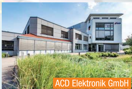
ACD Elektronik GmbH

ACD Elektronik GmbH Entwicklung mobiler Geräte und Anwendungen in der Industrie-elektronik und deren Produktion