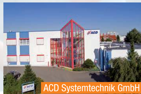
ACD Systemtechnik GmbH

ACD Antriebstechnik GmbH Entwicklung anforderungs-optimierter Antriebselektronik